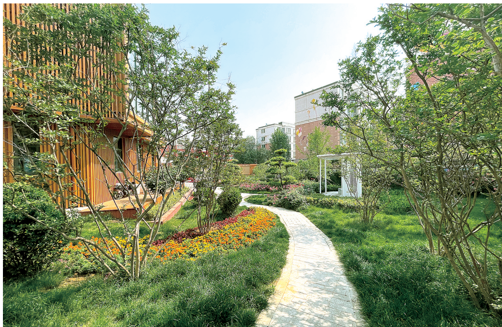
鹤壁山城区馨苑小区绿化风景

记者了解到,鹤壁的低房价主要集中在山城区和鹤山区,这些都是鹤壁市的老城区。随着鹤壁的新区建成后,人们逐渐向新区转移,原本坐落于矿区的老城区受到冷落,房子鲜有问津,房价自然就低了。