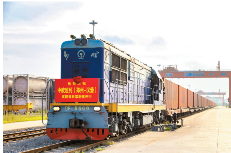
中欧班列飞速发展