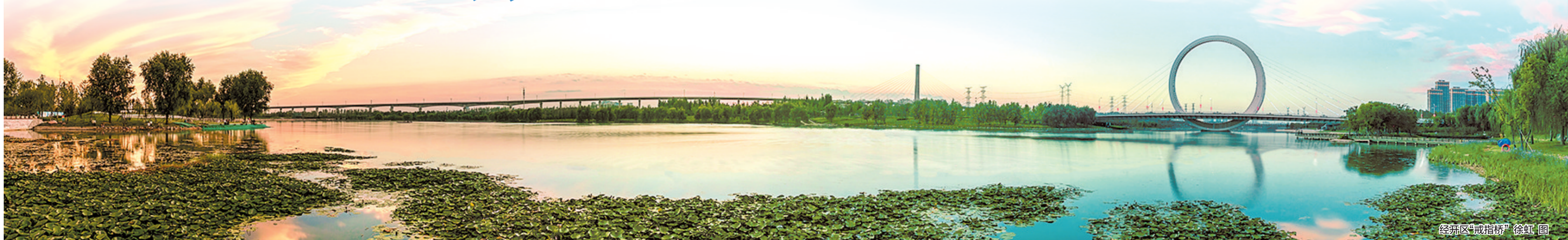
经开区“戒指桥”

三十年前,一颗“希望的种子”在郑东南的这片土地上孕育发芽。三十年后,一座国际化现代化的产业新城正在乘势崛起,并朝着“十四五”提前迈进全国经开区前20强的目标奋力前进。