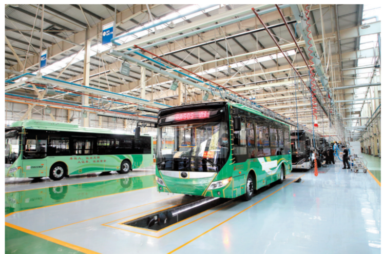
宇通整车出厂

促经济、谋建设。经开区在郑州“当好国家队、提升国际化、引领现代化河南建设”征程中挑大梁、当排头,走出一条中国式现代化经济技术开发区高质量发展之路。正观新闻·郑州晚报记者 王赛华 鲁慧