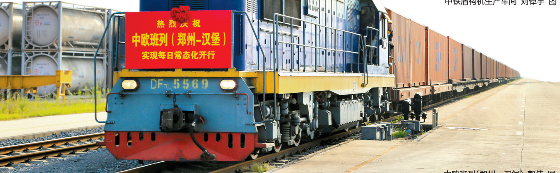
中欧班列(郑州—汉堡)

30年前,一颗“希望的种子”在郑东南的这片土地上孕育发芽。30年后,一座国际化现代化的产业新城正在乘势崛起,并朝着“十四五”提前迈入全国经开区前20强的目标奋力前进。