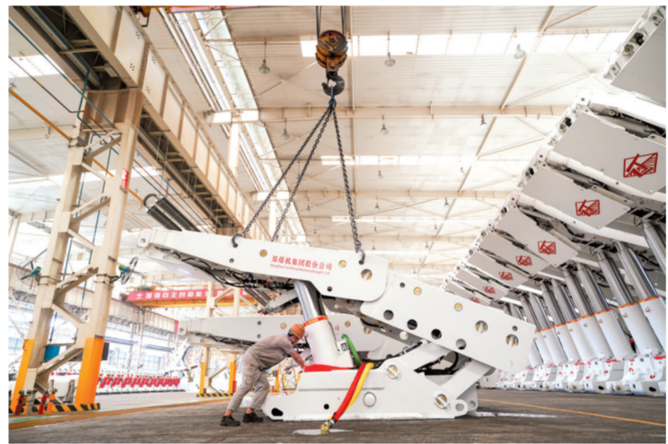
郑煤机生产线