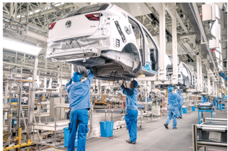
上汽集团郑州工厂生产线

经开区锚定先进制造业这一主攻方向,在高端制造、智能制造的赛道上奋勇争先,让更多产业产品迈向产业链、价值链的中高端,成为关键环。发展实体经济,重点在制造业;提升竞争能力,主体在制造业。作为河南省首家国家级“两业融合”示范区、河南省首家国家生态工业示范园区和河南省碳达峰试点园区,郑州经开区把握产业演进规律,牢固树立“项目为王”理念,高位嫁接传统产业、抢滩占先新兴产业、前瞻布局未来产业,加快构建现代化产业体系,努力实现直道冲刺、弯道超车、换道领跑,不断开创高质量发展新局面。