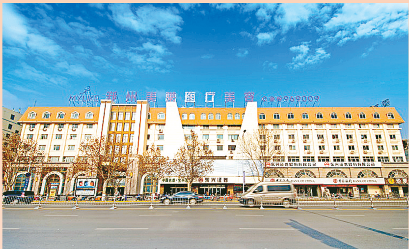
郑州美莱医疗美容医院坐落于金水路经三路向西100米路北