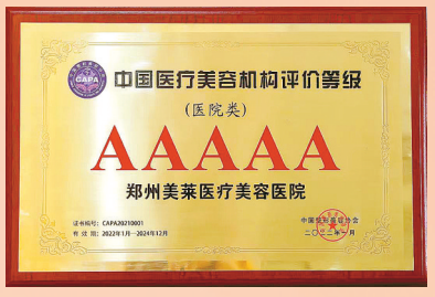
郑州美莱医疗美容医院被中国整形协会评为AAAAA级医美机构