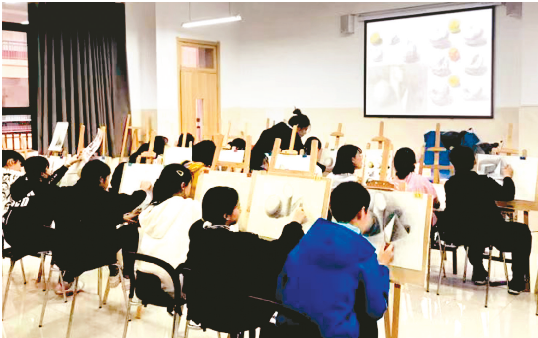
美术中考考生可充分利用美术特长,取长补短,步入名校