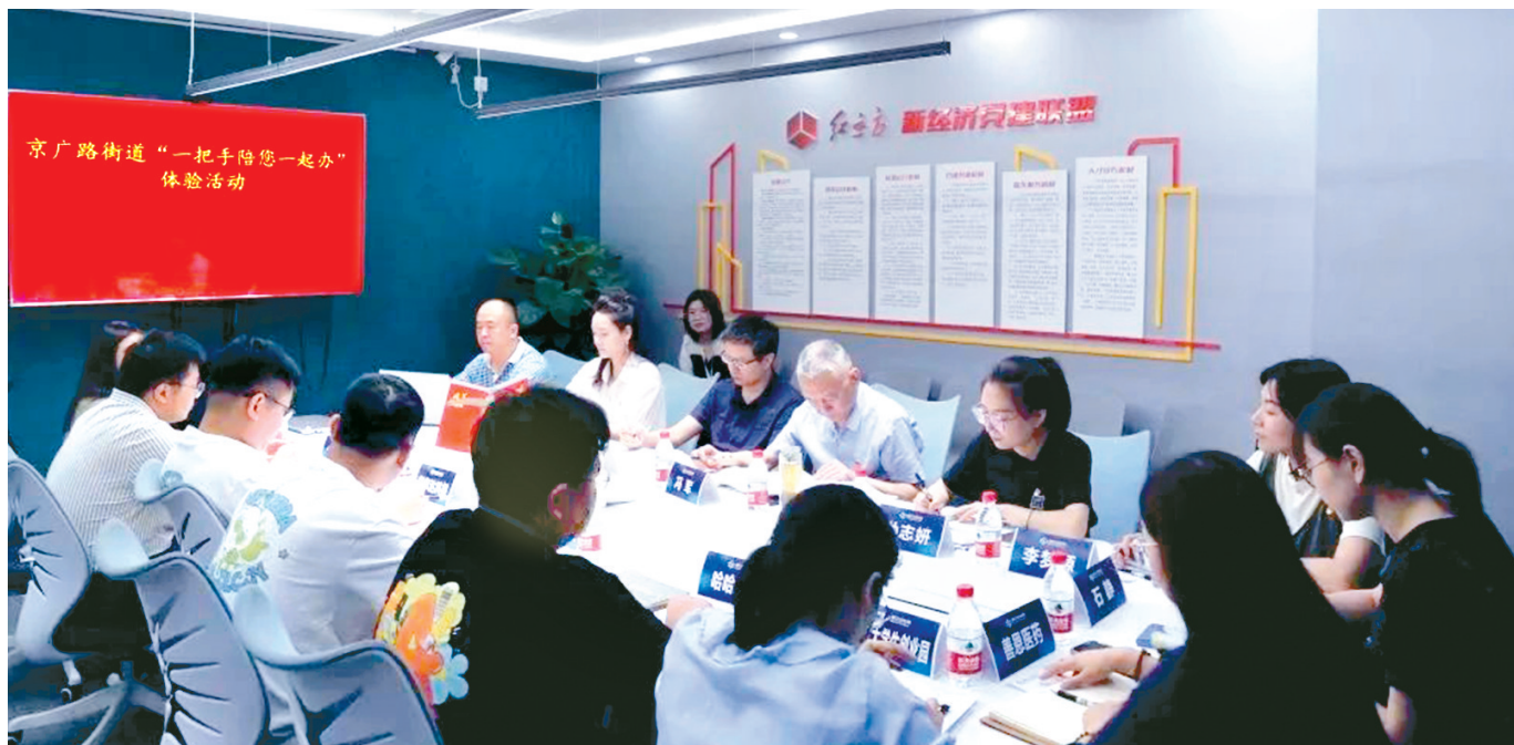
京广路街道开展“一把手陪您一起办”体验活动