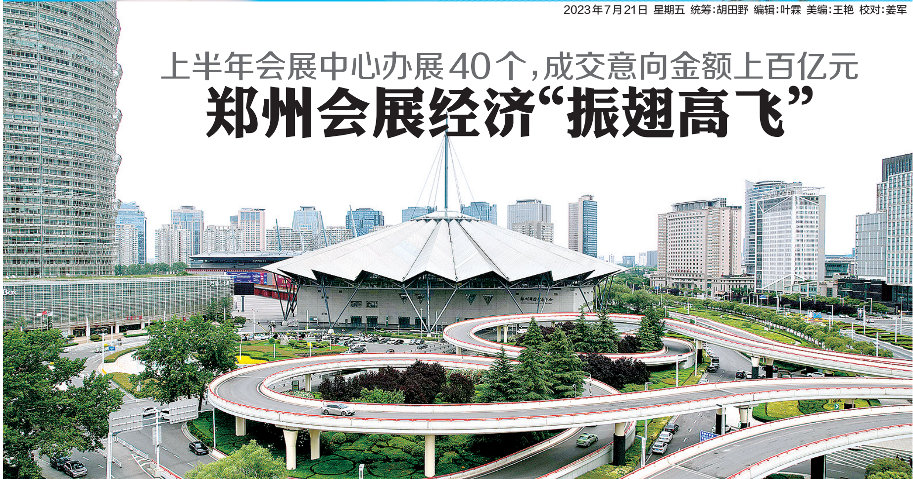
郑州国际会展中心

盛夏时节,2023河南省夏季种子信息交流暨产品展览会近日(7月3日)在郑州国际会展中心召开,集中展示了农药、肥料新产品、新技术。来自全国各地的500多家种子、农药、肥料企业齐聚现场,展馆内人来人往,合作社、种植大户等约几万人次参观驻足、洽谈合作。