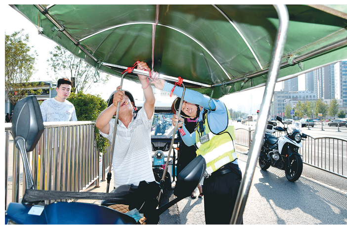
交警帮助驾驶人拆除加装的顶篷

近期有群众举报,二七商圈存在非法营运情况,希望相关部门进行整治。昨日,交警四支队联合多部门对此行为进行整治,查处多辆摩的和网约车。