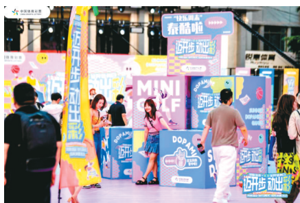
消夏运动会吸引了不少年轻人到场

为迎接第15个全民健身日,8月4日~7日,河南体彩在郑州市健康路省体育馆举办了为期四天的“迈开步 动出彩”体育消夏运动会活动,吸引了一大批市民参与!本次活动不仅为郑州市民提供了消夏娱乐场所,也吸引了不少年轻人到场,在炎炎夏日点燃了一股全民运动风潮!