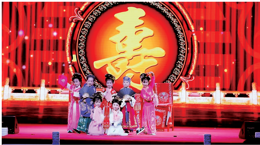
《五女拜寿》节目剧照

郑州市少儿戏曲小梅花大赛自2013年开展以来,始终承载以新时代梨园新声更好传承中华优秀传统文化的使命,不仅赓续着中华民族文化根脉,促进了我市戏曲艺术的传承与发展,还见证着文艺郑州、戏