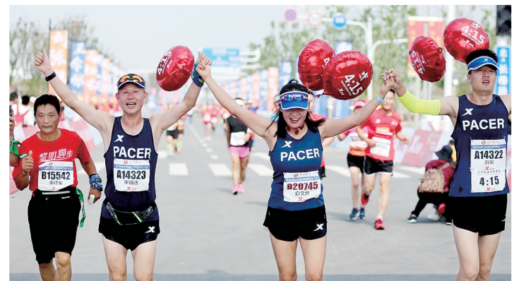
“官兔”对个人实力、比赛经验等方面都有较高要求

本报讯(正观新闻·郑州晚报记者 郭韬略)将于10月29日鸣枪起跑的“郑州银行杯”2023郑州·黄河马拉松赛的筹备工作正紧锣密鼓地进行,为了让参赛选手们能更好地了解比赛时间进程,控制配速,顺利完成比赛,本次赛事的“官兔”招募工作即日起正式启动。根据计划,组委会将招募包括全程、半程马拉松在内的官方配速员共59名。