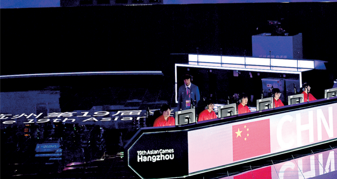
9月27日,中国队选手在比赛中进攻中国澳门队高地防御塔