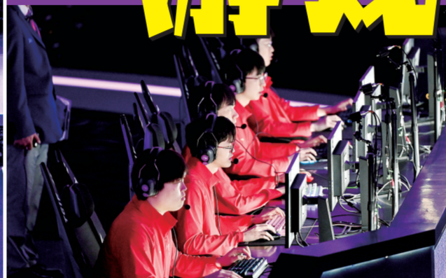
王者荣耀亚运版本决赛中国队夺冠

人总会在不经意间暴露出自己的落伍。电子竞技都被列入亚运会的正式比赛项目了,我还动辄说“电子游戏”,没少因为此遭到“电子竞技”爱好者的白眼。