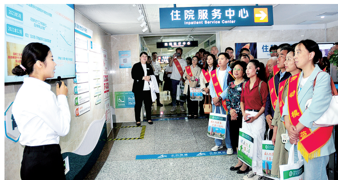
劳模(工匠)代表在市中心医院参观

本报讯(正观新闻·郑州晚报记者 王梓文/图)昨日上午,郑州市劳模(工匠)就医优诊窗口揭牌仪式在市中心医院举行。记者了解到,河南省中医院和郑州市中心医院即日起开设劳模(工匠)就医优诊绿色通道,分别在门诊挂号、导诊台等窗口