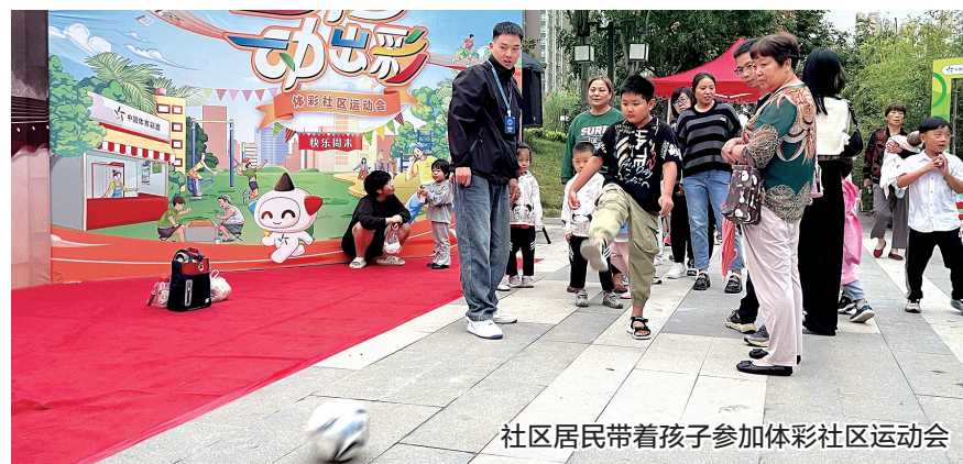
社区居民带着孩子参加体彩社区运动会