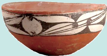
白衣彩陶钵 仰韶文化

钵口沿及腹上部施有白色陶衣,其上用褐彩绘弧线三角纹、圆点纹、线纹等组成的图案。该钵出土于郑州大河村遗址,为仰韶文化彩陶的代表性器物。