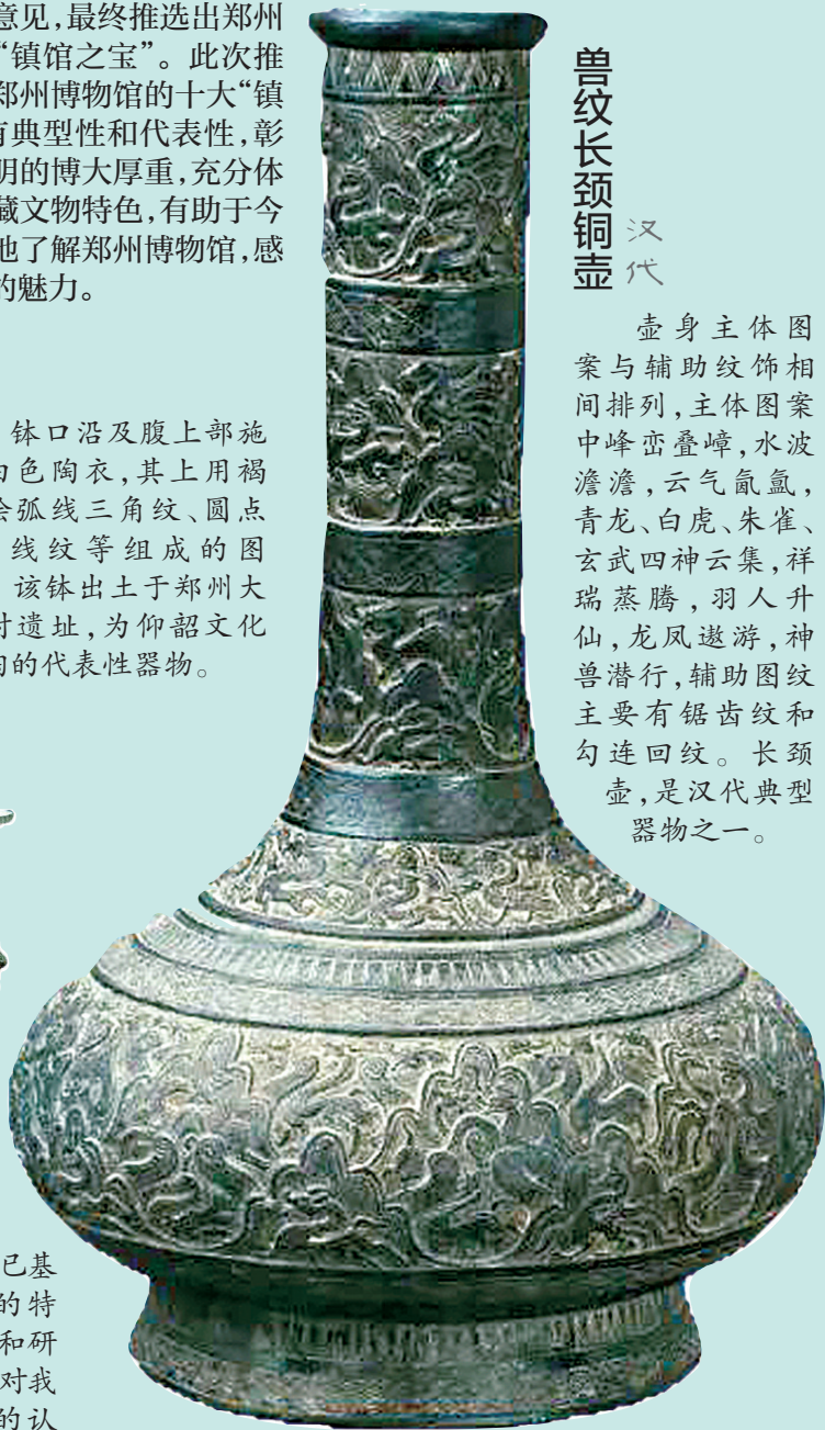
兽纹长颈铜壶 汉代

壶身主体图案与辅助纹饰相间排列,主体图案中峰峦叠嶂,水波澹澹,云气氤氲,青龙、白虎、朱雀、玄武四神云集,祥瑞蒸腾,羽人升仙,龙凤遨游,神兽潜行,辅助图纹主要有锯齿纹和勾连回纹。长颈壶,是汉代典型器物之一。