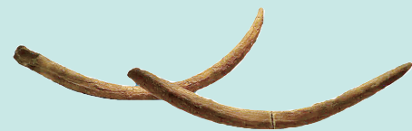
第四纪更新世 象牙化石

这套九鼎八簋出土于新郑郑国祭祀遗址,是当时诸侯崛起、王权衰微的体现,对于研究郑国历史和春秋时期社会发展具有重要意义。