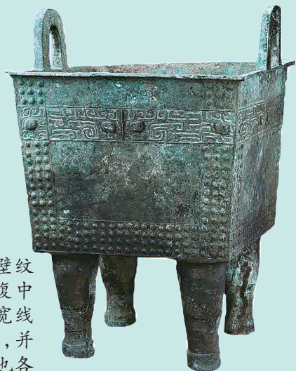
兽面乳钉纹铜方鼎 商代

鼎腹四壁纹饰类同,上腹中部皆饰一组宽线条兽面纹带,并在两壁之交也各构成一组兽面纹;鼎腹两侧和下腹饰带状乳钉纹。传说夏禹曾收九牧之金铸九鼎,以象征九州,铜鼎成为国家政权的象征。此鼎造型雄浑大气,纹饰古朴庄严,铸造工艺精湛,属于商代王室重器,堪称商代前期造型装饰艺术与礼制宗教内涵和谐统一的典范之作。