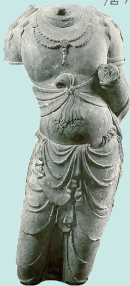
佚名菩萨石造像 唐代

造像整体呈“S”形身姿,是唐代“中国式菩萨”曼妙体态的集中体现,反映了唐代佛教艺术的雍容气度和审美雅趣,有东方“维纳斯”之美誉,表现出极高的艺术造诣。