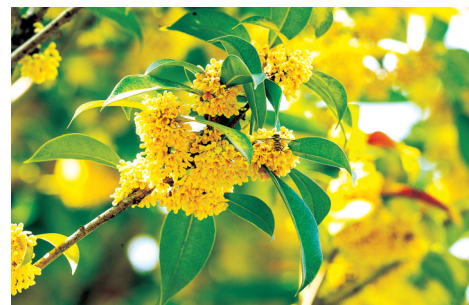
南环公园苏园 地址:南四环与灵山路交叉口