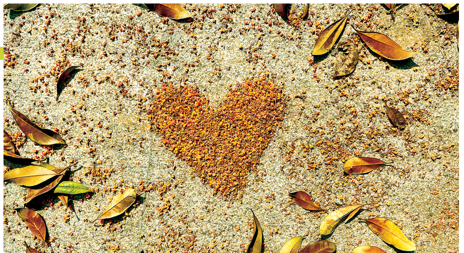
经纬广场 地址:纬二路与经一路交叉口西北角