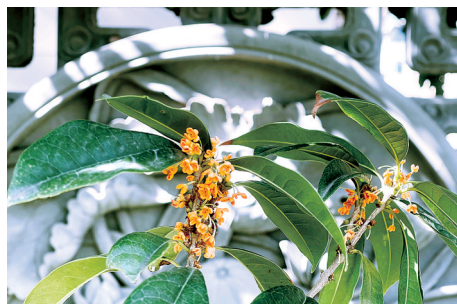
街角公园 地址:黄河路与经三路交叉口西南角