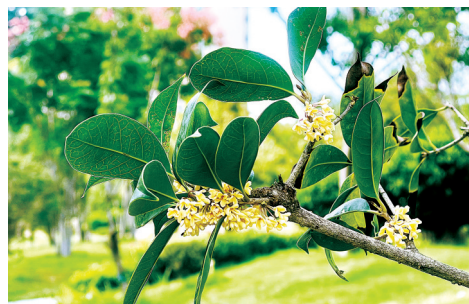
康桥朗城公园 地址:康桥朗城1号院与2号院之间