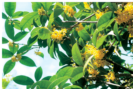
金沙月季园 地址:金水路与京广快速路交叉口