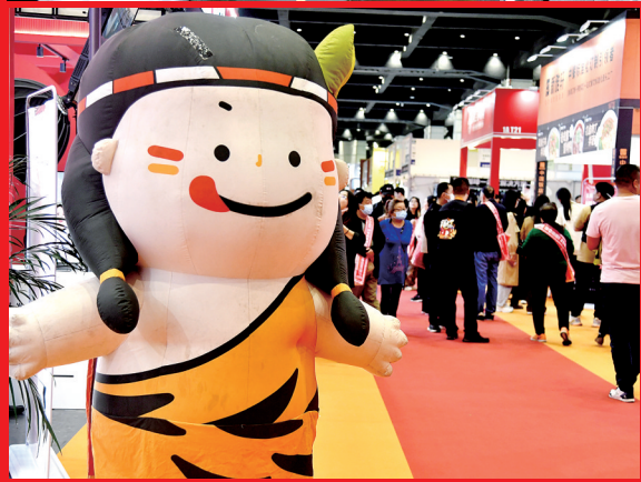
全球好物汇聚郑州