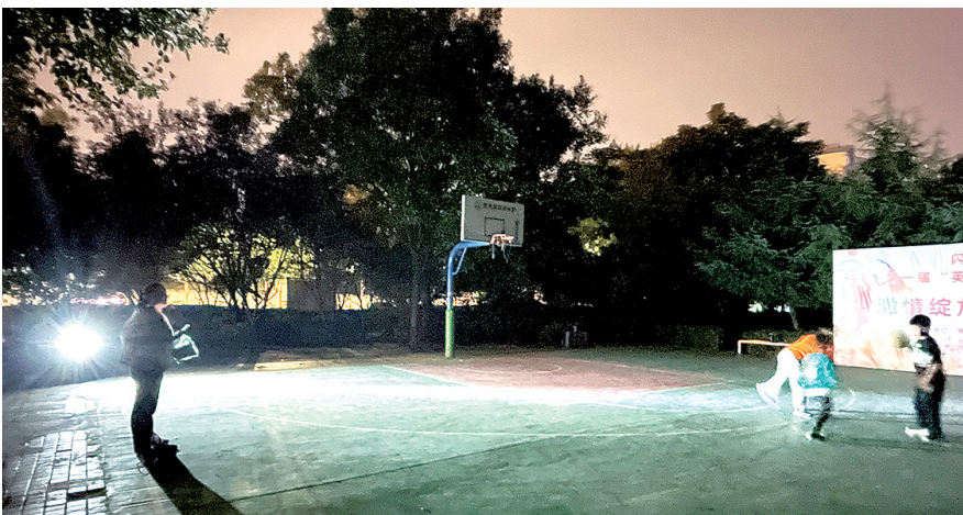
孩子借着电动车灯光打篮球

记者致电郑州市城市照明灯饰管理处, 工作人员称他们负责城市照明设备的管理和维护, 设立照