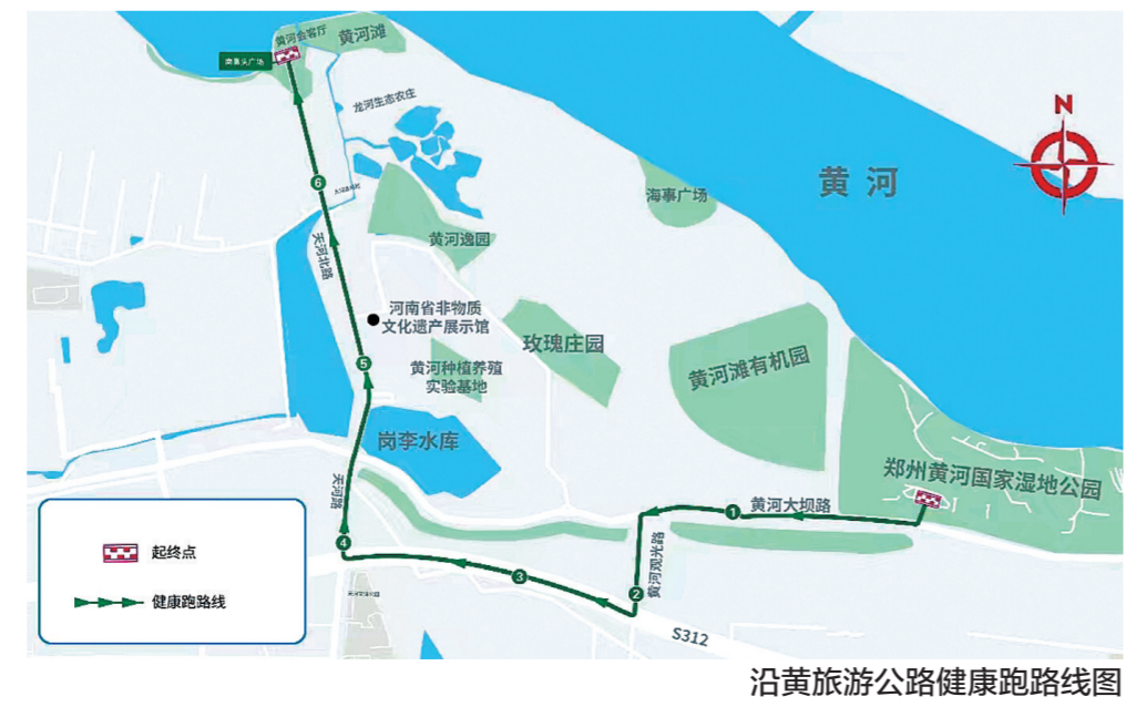
沿黄旅游公路健康跑路线图

后推出了短视频大赛、赛道标语征集、摄影大赛、线上马拉松等形式多样的赛事配套活动,给大家满满的体验感。 目前,距离郑马鸣枪开跑还有8天时间,赛事的各项准备工作正在有条不紊的进行。接下来,组委会将紧紧围绕体育强国和健康中国建设,把标准化、专业化、规范化的办赛理念落实到赛事筹备工作中,把赛事打造成讲好“黄河故事”、塑造郑州“最美黄河”形象、叫响“黄河之都”城市名片的重要平台,让每一个来到郑州参赛的选手都不虚此行。