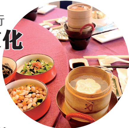
泰州早茶品种丰富

的城市之一，GDP3年平均增幅江苏第一，总量列全国第43位。泰州紧扣转型升级，狠抓产业链群培育，着力打造“一个产业体系、四个特色产业集群”。其中，生物医药、海工船舶产业入选国家先进制造业集群，总数占到江苏的1/5。