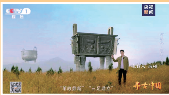
《寻古中国·河洛记》视频截图

由中央广播电视总台和国家文物局联合摄制的大型系列纪录片《寻古中国·河洛记》，昨日起在央视综合频道(CCTV-1)22时30分档开播。