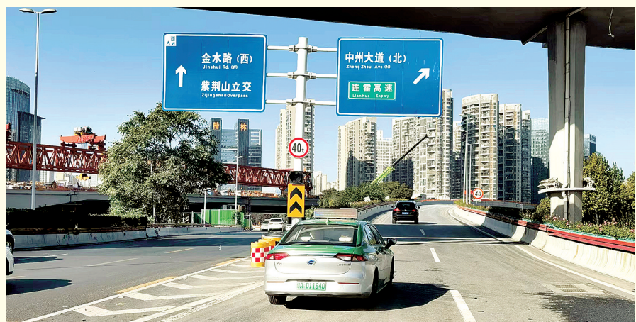
12条匝道全部恢复通车