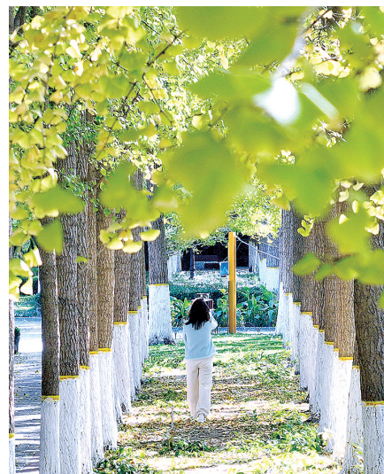
文博广场银杏叶已有五六成黄

本报讯(正观新闻·郑州晚报记者 裴其娟/文) 今年,郑州郊区一些地段的银杏80%叶片已变黄,金灿灿令人陶醉。但由于气候原因,市内公园广场的银杏树叶由绿变黄的时间比去年晚一周左右。