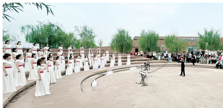
黄河合唱周“户外音乐会”

“黄河颂”户外音乐会中,来自广阔草原的内蒙古师范大学音乐学院合唱团、来自黄河之源的青海师范大学音乐学院合唱团等优秀获奖团队,以及中国音乐家协会合唱联盟的专家导师齐聚黄河南岸,与市民游客一起歌唱黄河,歌唱美好新时代。