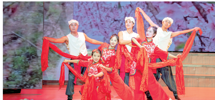
开幕式上的精彩表演