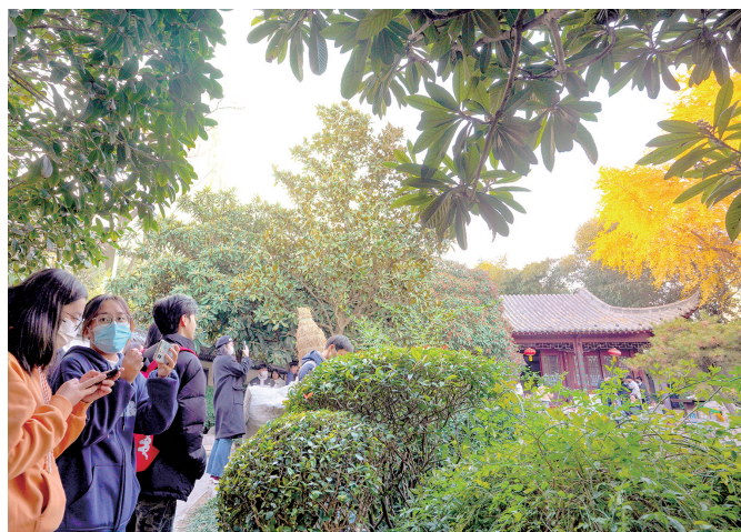
昨日,市民趁着晴好游玩紫荆山公园梦溪园

本报讯(正观新闻·郑州晚报记者 张华/文)省气象台12月3日预报,4日、5日回暖还将继续,省内大部将升至15℃以上,部分地区甚至接近20℃。