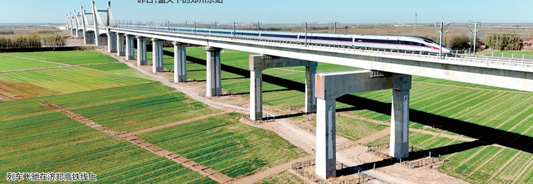
列车飞驰在济郑高铁线上

济郑高铁是国家“八纵八横”高速铁路网的区域连接线，是河南“米”字形高铁网的最后一笔。济郑高铁全线贯通运营后，将进一步巩固河南在全国综合交通体系中的枢纽地位，最大程度释放河南“米”字形高铁网辐射力、带动力，实现中原城市群与山东半岛城市群间互联互通，最大限度便利沿线人民群众出行，对于推动黄河流域生态保护，促进区域经济社会高质量发展，具有十分重要的意义。