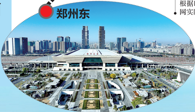
昨日，蓝天下的郑州东站