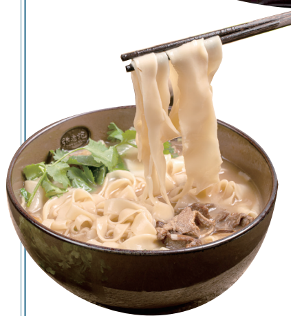
胡辣汤、烩面是郑州的传统名吃