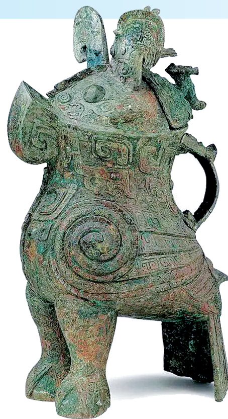
河南博物院镇馆之宝妇好鸮尊

随着河南、山东的省会城市实现高铁直连直通,打造豫鲁1.5小时生活圈,人们最关心的就是济郑高铁13个站点沿途有啥好吃好玩的。从郑州的胡辣汤、烩面,到新乡的红焖羊肉、濮阳的裹凉皮,再到茌平的圆铃大枣、济南的把子肉;从济南的趵突泉、大明湖,到聊城的水上古城、南乐的仓颉故里,再到新乡的八里沟、郑州的少林寺……一路美食、美景,让我们换个城市过周末吧!