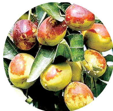
茌平被誉为“中国圆铃枣之乡”