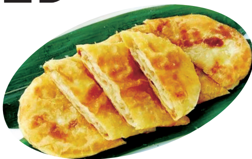
已有200多年历史的呱嗒皮酥里嫩,是聊城传统名吃