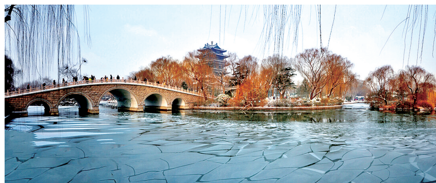
大明湖从古至今就有文人墨客纷至沓来