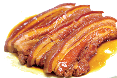
把子肉是传统鲁菜,早在清朝就在鲁地流传