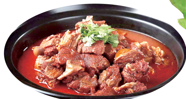
红焖羊肉起源于河南新乡