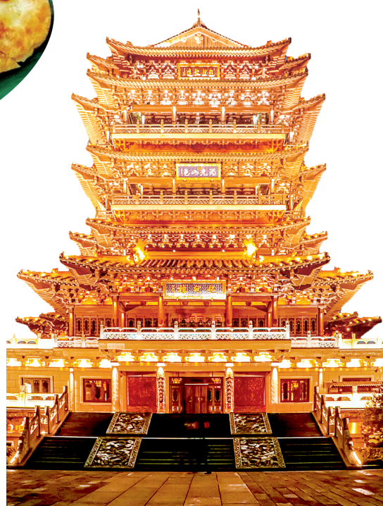
超然楼有“江北第一楼”的美誉