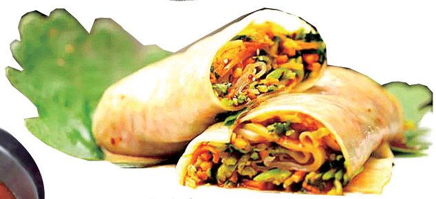
裹凉皮是濮阳传统小吃