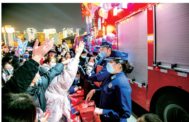
消防救援人员宣传冬季防火安全常识

寒冷干燥是冬季一大特点,持续低温天气更是让人直呼“冷冷冷”,此时浴霸又登场了。一到冬天,浴霸起火、爆炸等现象就频频上演。前段时间,商丘一居民家中浴霸起火,好在消防员处置及时,没有酿成大灾。