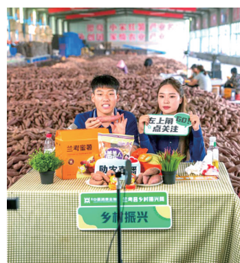
中原消费金融搭建公益助农直播间开展在线直播