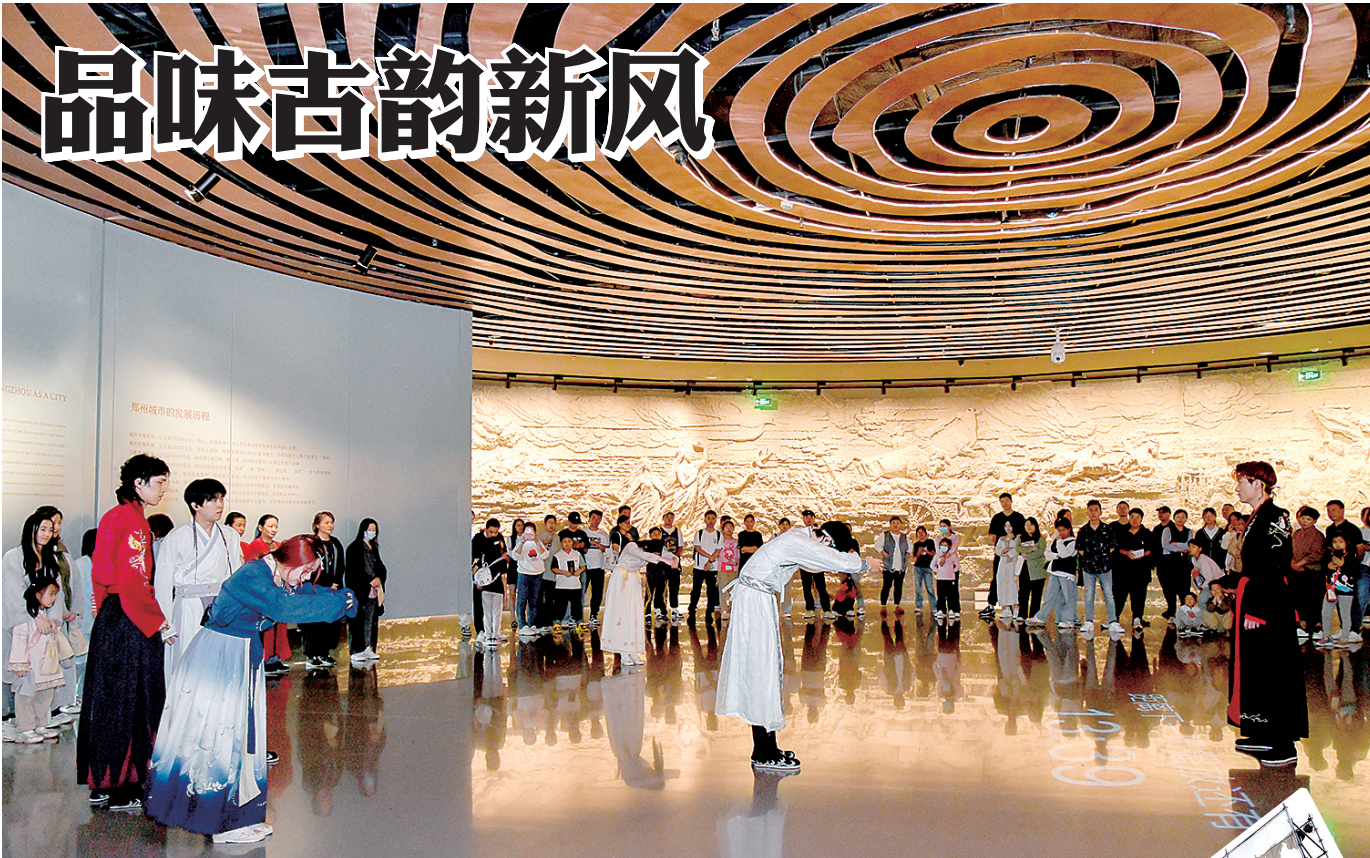
商都遗址博物院的沉浸式夜游带游客解谜《商都往事》