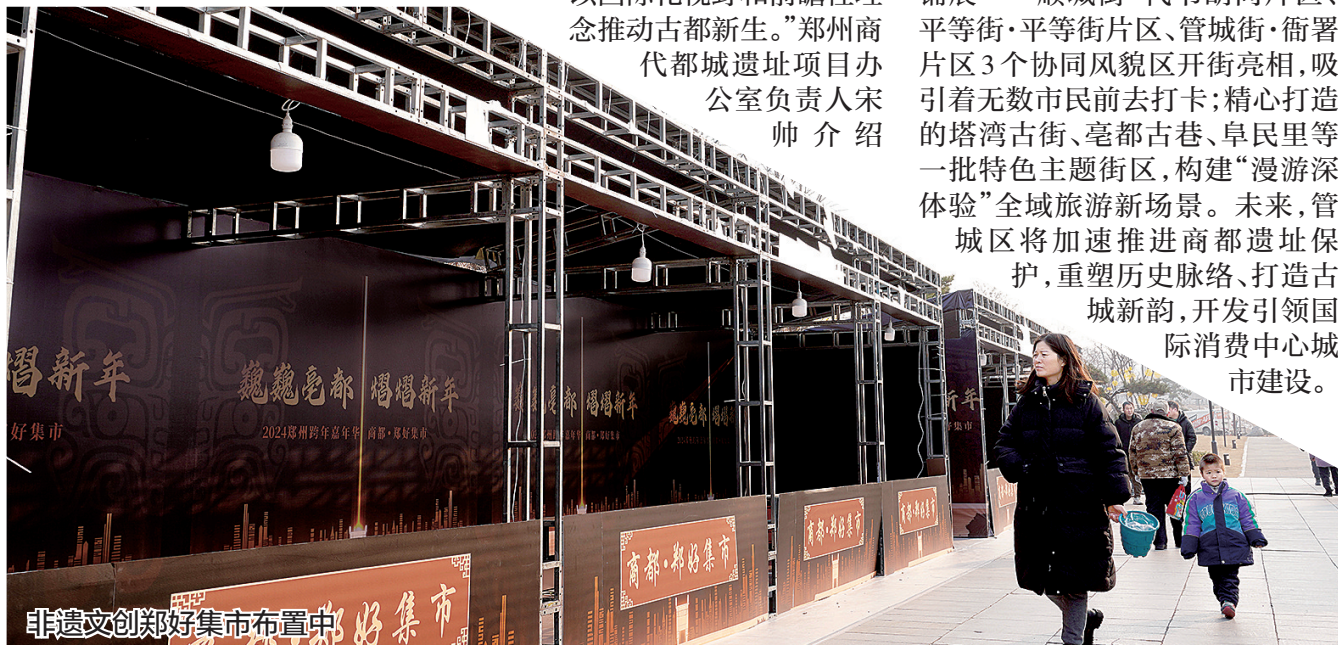
非遗文创好集市布置中