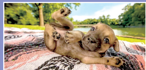
The Kennel Club举办的狗狗摄影大赛的最佳作品之一