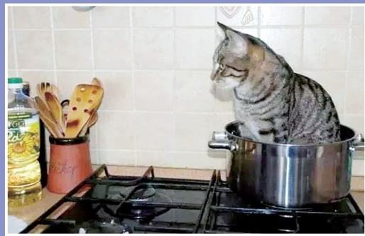
见到盒状物就要占为己有,猫窝就是不爱待……