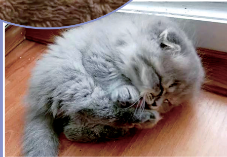
弱小可怜无助的小蓝猫