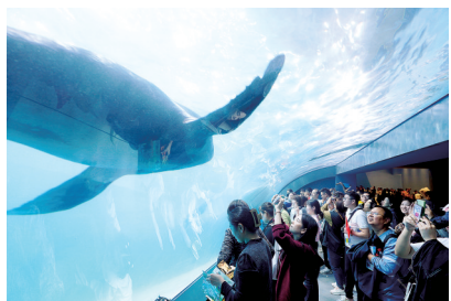
郑州海昌海洋公园