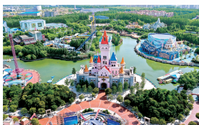
郑州方特欢乐世界