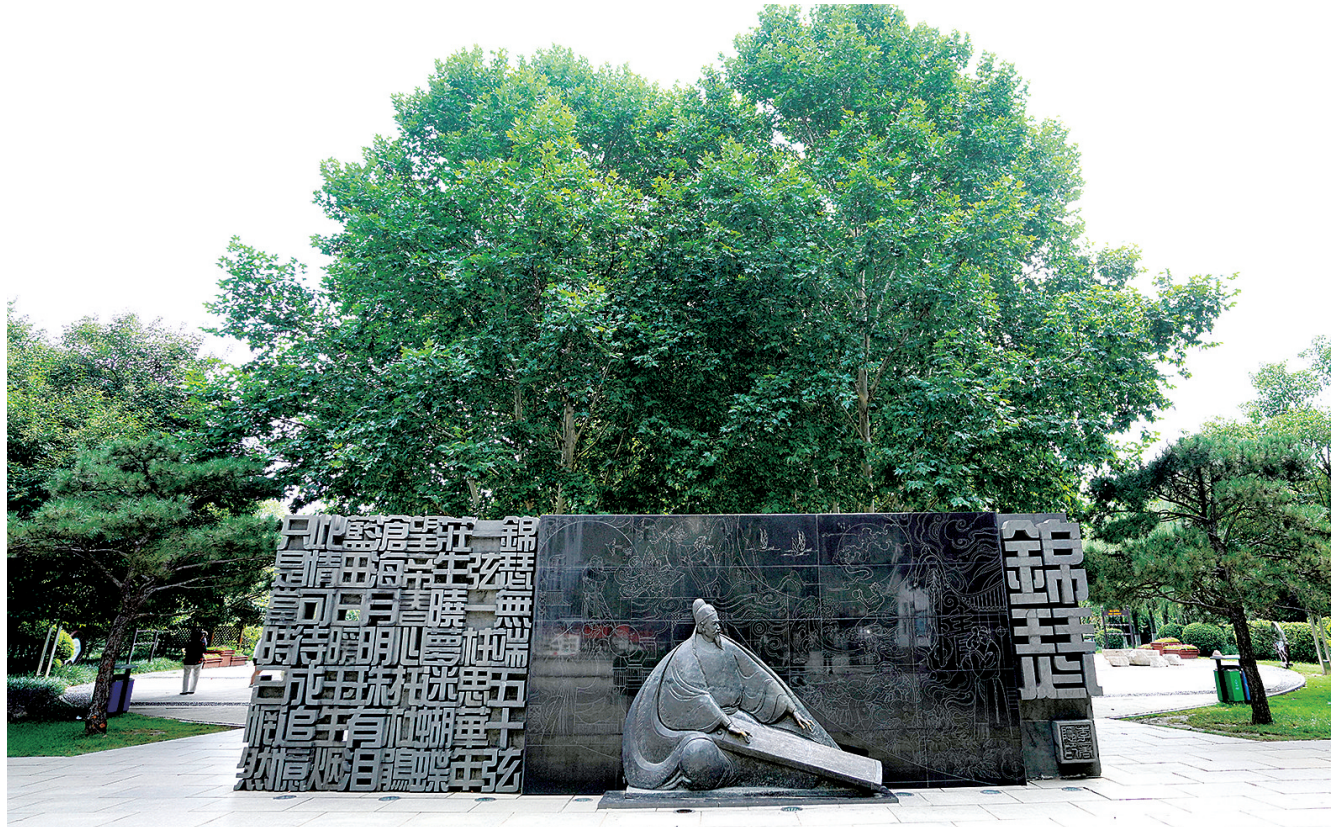
李商隐公园以中国传统园林特色为基调