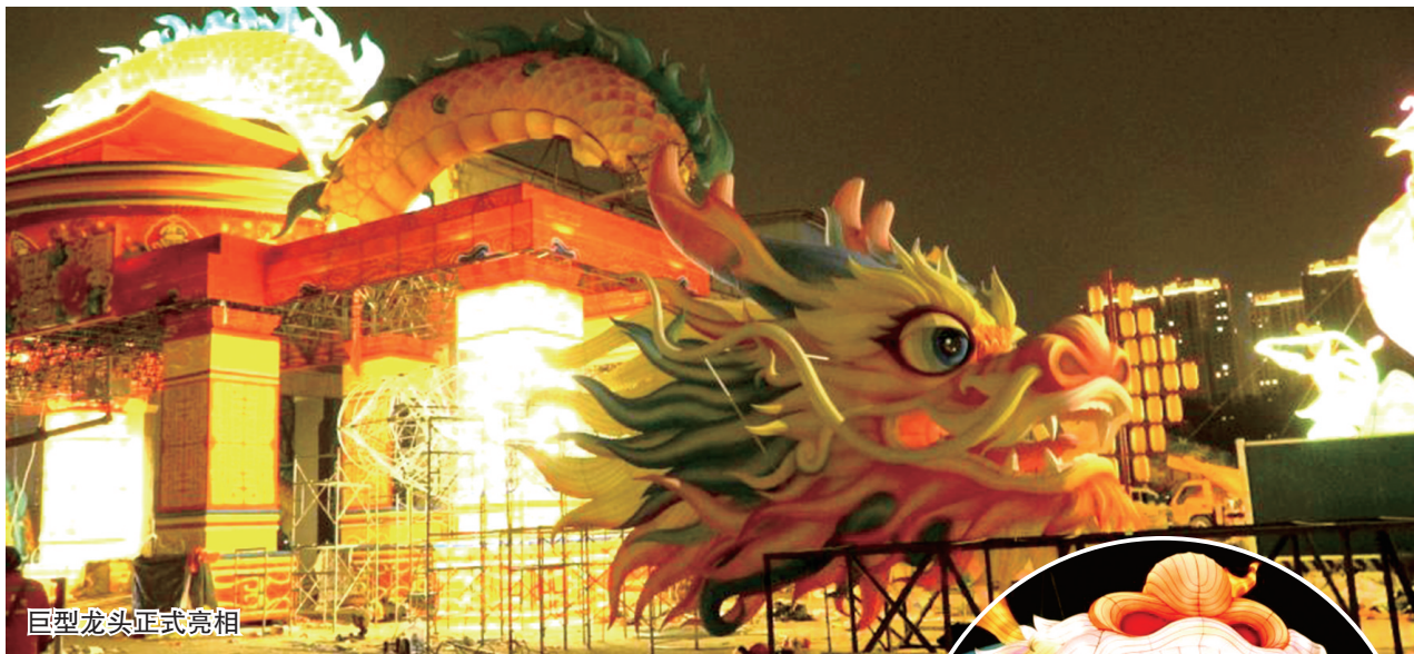
巨型龙头正式亮相

本报讯(正观新闻·郑州晚报记者 程帅星/文)“中原奇妙游——郑州银行龙年迎春灯会”将于2月2日至3月24日在郑州二砂文创园举办,它是河南省“春满中原·老家河南”主题活动五大主会场之一。届时,巨龙、苍颉、豫象、火车……超多巨型灯组将刷新河南灯展历史纪录。