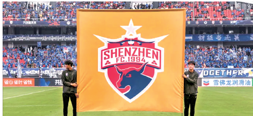
深圳队继大连队之后也宣布解散

但在“金元足球”大潮中盲目跟风积累下的巨额债务最终导致俱乐部无以为继,在中国足协严格准入制度的大背景下,最终不得不宣布解散。早在5天前,同样因为历史债务问题,大连人俱乐部也宣布解散。