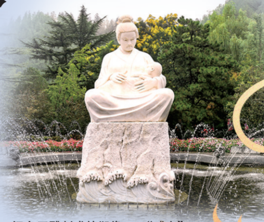
汉白玉雕刻成的塑像——“哺育” 正观新闻·郑州晚报记者 马健 图