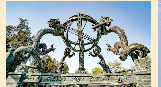
观星台景区上的浑仪

登封的观星台有一个“中国天文博物院”。观星台建于元代至元十三年，公元1276年，距今已有700年的历史，它是我国现存最古老的天文台，是世界上现存较早天文科学建筑物。现在观星台景区陈列着黄道经纬仪、简仪、浑仪等古代天文仪器的复制器，很多仪器上面有龙的形象，栩栩如生。