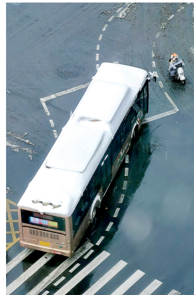
“顶”雪而行 雪后郑州,整座城市银装素裹,城市迎来通勤考验。 曹清华