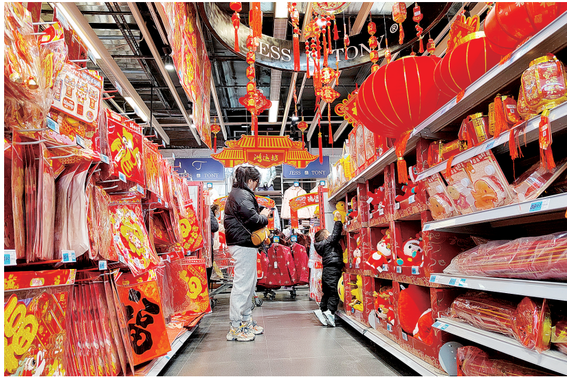
点燃新年购物第一把火 1月21日,郑州紫荆山百货大楼,市民在挑选年货。 连红胜