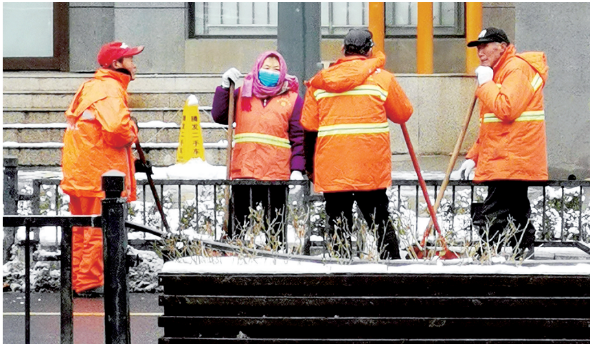
“橙色”铁军 1月16日清晨,郑州环卫工人们手持雪铲,集中清理人行道两侧积雪,一支“橙色”的清雪铁军展示着勇战风雪的豪情。 王勇