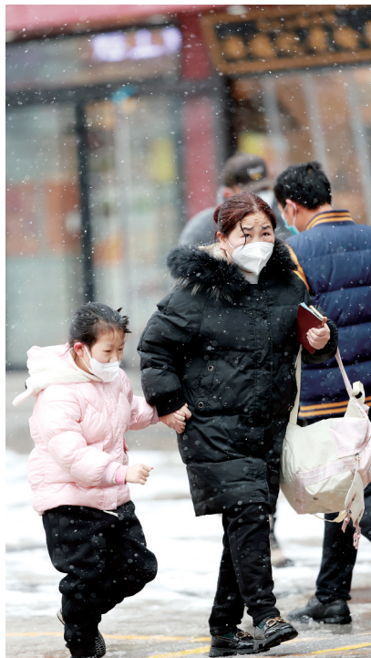
飘雪 郑州火车站,天空飘着雪花,一对母女快速前行。 贾建伟