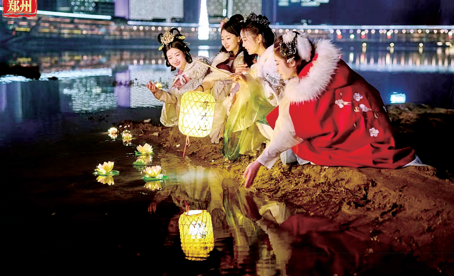
汉服古韵迎新春 一月,北龙湖金融岛上,汉服与花灯交相辉映。 崔俞