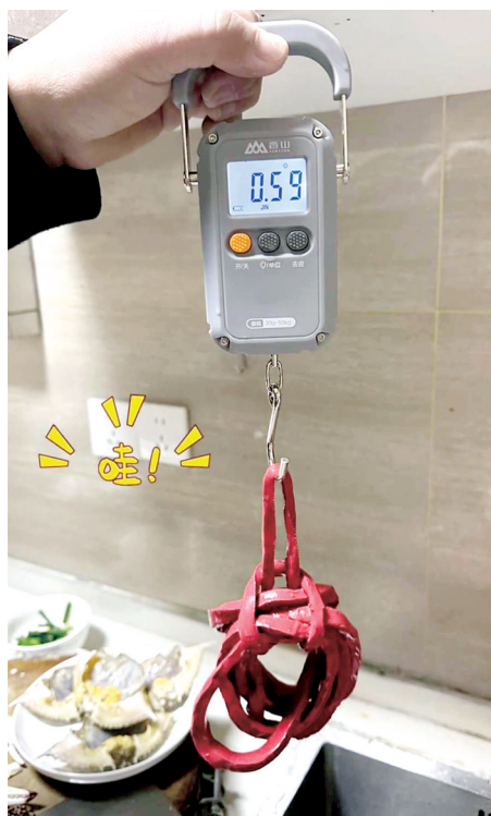
皮绳称重（网络视频截图）

品等自觉采用轻薄包装，并明确告知消费者包装的重量。消费者如遇到绳子加重问题，应主动询价，或通过合适途径进行投诉，保护自己的权益。期盼各方的共同努力，让消费者能够明明白白地享受美食。