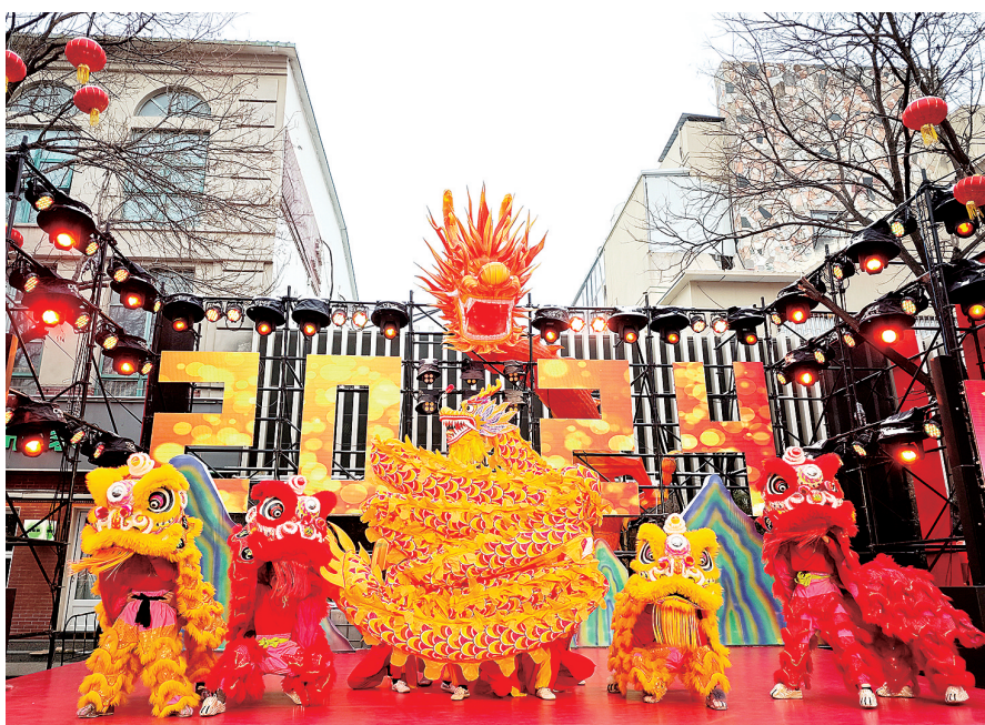
金水区首届新春民俗文化节开幕式现场