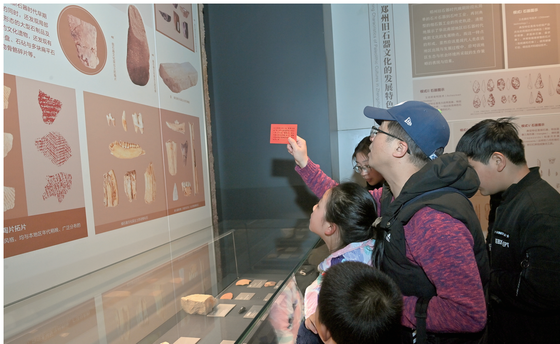
市民参与问答趣味闯关

本报讯(正观新闻·郑州晚报记者 左丽慧 实习生 丁锦文/图)2月17日,郑州市文物考古研究院考古博物馆举办的“沉浸式趣味闯关”活动,用趣味横生的问答互动引导观众参观旧石器展厅、牙璋展厅、百年展厅,增进人们对华夏文明的了解和文化自信。丰厚精