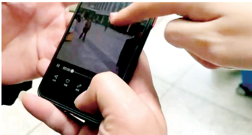
女子查看男子手机相册 视频截图

近段时间，“偷拍乌龙”事件多次发生。例如，广州地铁一女子指责大叔偷拍，四川一小伙被指责鞋