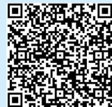
扫码速读政府工作报告