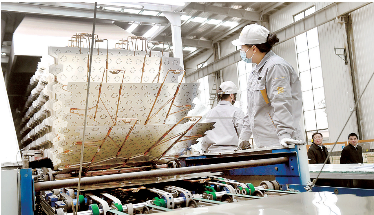
年产300亿只的超级易拉盖项目“含新量”喜人

躬身加油干，春色倍还人。记者走进郑州重点项目建设工地、先进制造业基地、大型商业综合体、物流分拨中心等多处基层一线采访，感受绿城经济发展的强劲脉动。