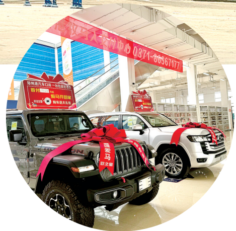
郑欧班列进口商品展示

据介绍，河南进境粮食指定口岸积极拓展粮食进口国别和货物类别，进口来自乌兹别克斯坦、哈萨克斯坦、俄罗斯等国家的绿豆、小麦、大麦、麦麸、燕麦、亚麻籽、葵花籽等货物，极大丰富了进口品类。此外，与万邦国际集团、河南省海华农产品有限公司、中储发展股份有限公司郑州南阳寨分公司等一批粮食经营企业加强业务合作，为未来发展和进一步开展深加工蓄势赋能。