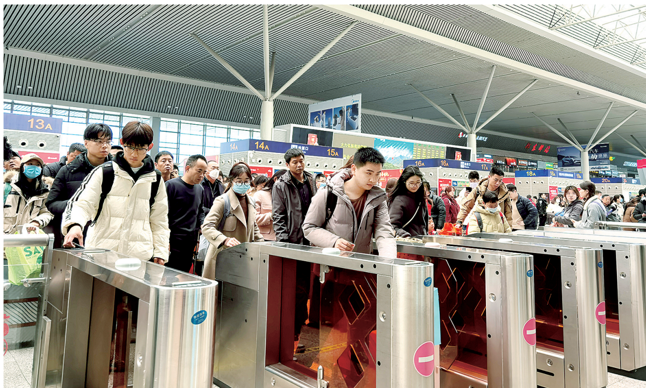
人潮涌动的高铁站秩序井然

流动意味着活力,活力升腾着经济。节节攀升的客流数据背后,折射出“流动的郑州”充满经济活力和发展潜力。