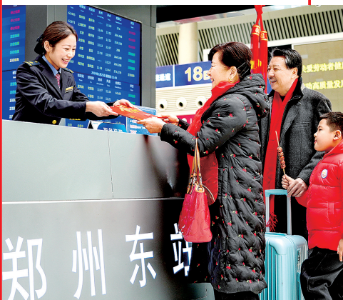
郑州东站为旅客提供暖心服务