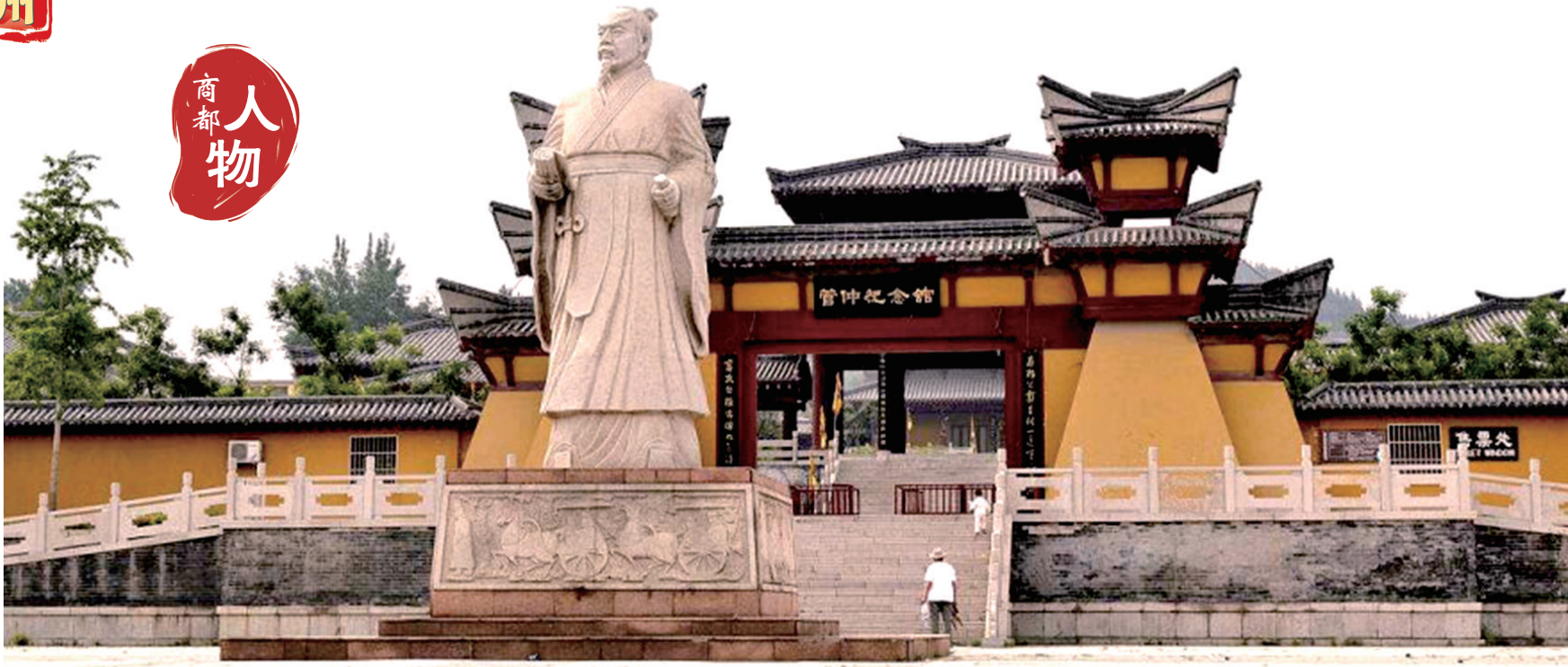
管仲纪念馆前的管仲塑像