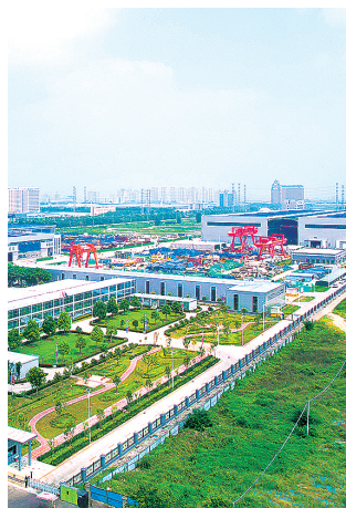
中铁智能化高端装备产业园

2023年,我市不断强化知识产权促进运用,增强企业创新发展能力,一系列知识产权指标喜讯不断,为企业由“制造”变“智造”注入源头活水,浇灌出郑州新质生产力高速发展累累硕果。