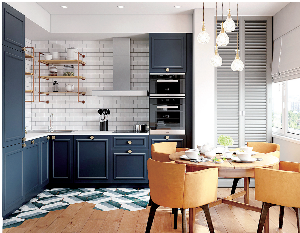
全屋定制的厨房可以根据个人需求进行设计

调查数据显示,随着80后、90后成为消费主力,他们对定制化、个性化的需求更加明显。业内人士分析,全屋定制能够满足消费者对家居风格的个性化追求,具有广阔的市场前景。