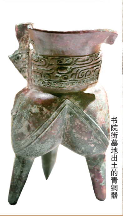
书院街墓地出土的青铜器