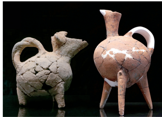
永城王庄遗址出土的陶器