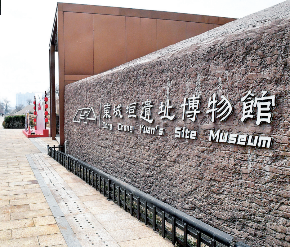
目前部分出土文物正在东城垣遗址博物馆展出