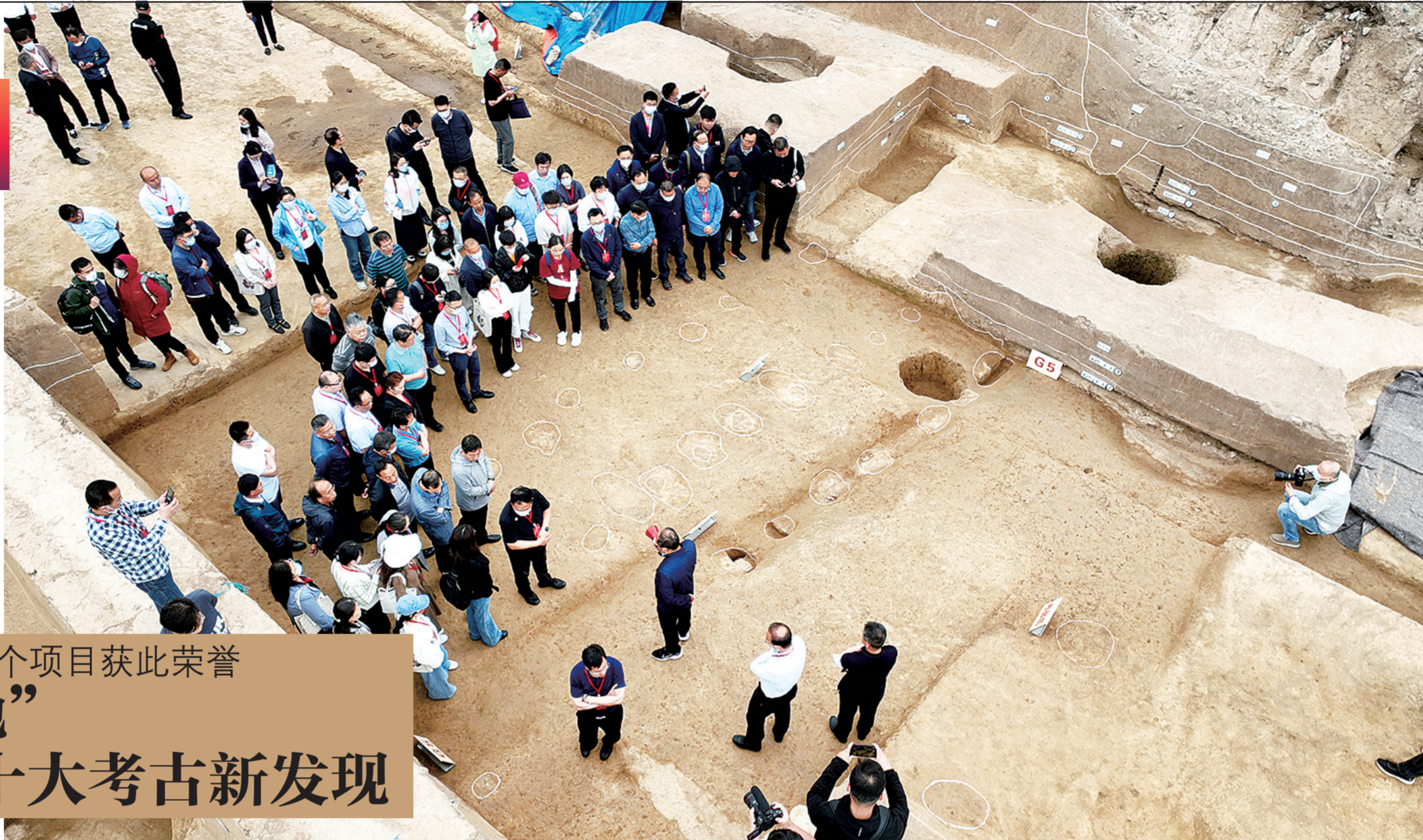
专家在书院街墓地考古现场