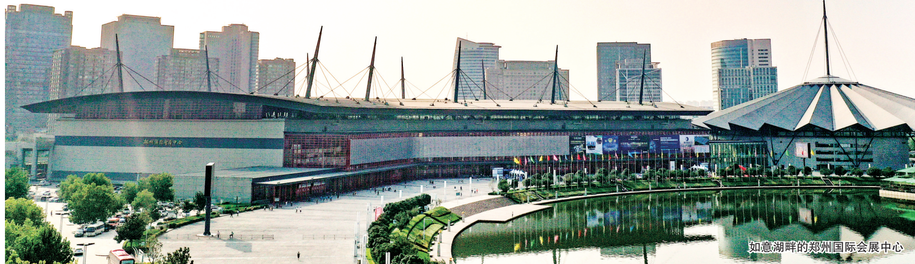
如意湖畔的郑州国际会展中心