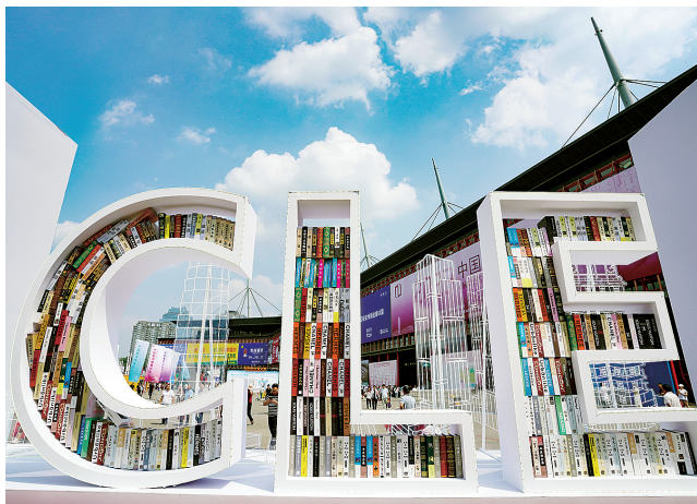
中国图书馆展览会去年在郑举办

会展经营主体活力迸发。汇聚一批带动能力强的会展链主企业和组织机构，本土会展企业不断做大做强做优，培育一批主业突出、市场竞争力强的会展企业。到2025年，会展企业数量超过1000家，打造2~3家具有国际竞争力的会展企业，具有全国影响力的会展企业达到10家。