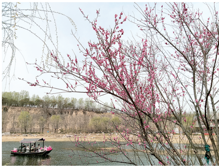
花船 贾鲁水镇花朝节十二花神河上巡游 余涵