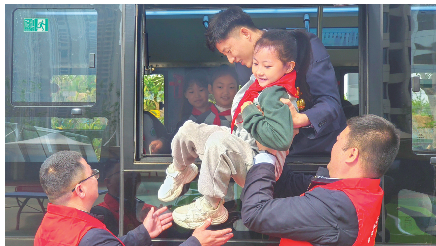
公交志愿者组织学生开展逃生演练

在郑州市景悦城第一小学,B5路青年文明号团员志愿服务队把公交车开进校园,让学生们走进车厢,开展两种失火逃生模拟情景演练,让学生们亲身体会危险来临时如何学会保护自己。