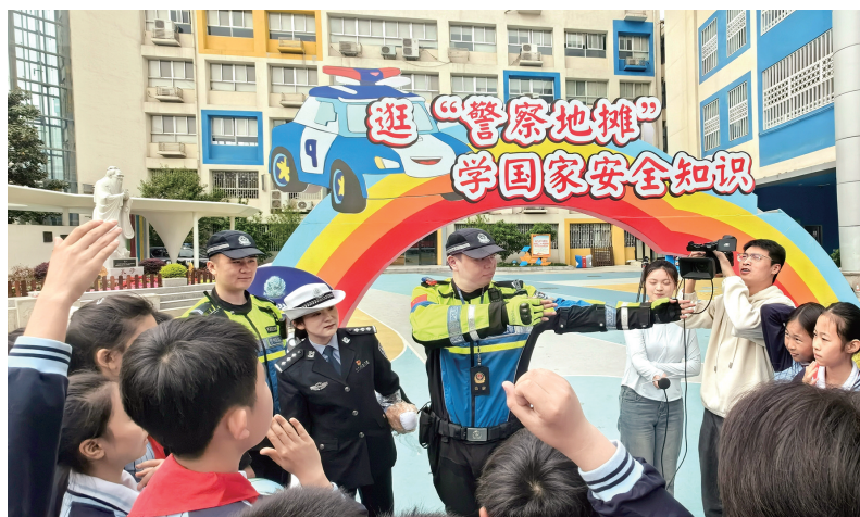
郑州警方进校园宣传国家安全知识

本报讯(记者 张玉东 通讯员 张芳冰 文/图)“大家知道什么是国家安全吗?”“维护国家安全8个‘不’,你做到了吗?”“发现身边有危害国家安全的行为怎么办?”4月15日是第九个全民国家安全教育日,昨日上午,郑州市公安局在郑州师范学院附属小学开展集中宣传活动,为师生们带来了一场沉浸式、互动式的国家安全教育学习体验。