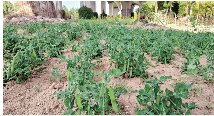
绿化带里种的豌豆

“原来里边都是草,很少见到有人打理,于是就有了几块菜地。”对于绿化带内种植的青菜,在此散步的市民表示是三四月份才出现这种情况,在此种菜